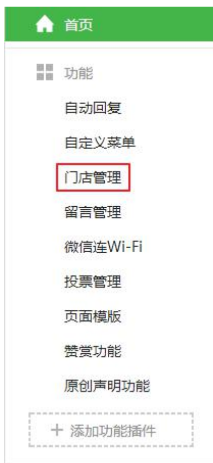
图表 6 公众号后台导航栏 a