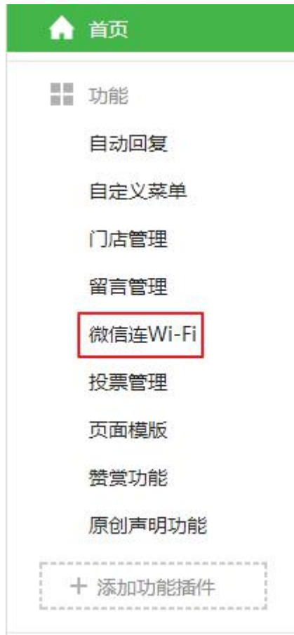
图表 8 公众号后台导航栏 b

5 在微信连 Wi-Fi 的设置页面，点击“设备管理”进入设备管理的标签页，如下图所示：