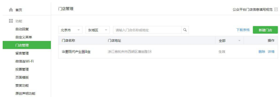
图表 7 公众号后台设备管理页面