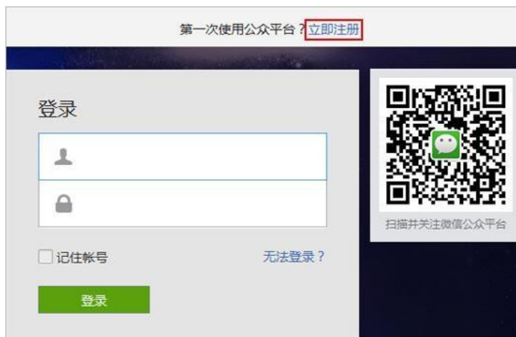
图表 1 微信公众平台登录页面