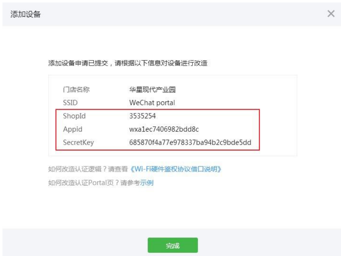
图表 11 微信商店公众号信息

保存设置后将会出现微信商店信息，其中下图中的红框部分将会在 GWN 产品 portal 设置中用到。