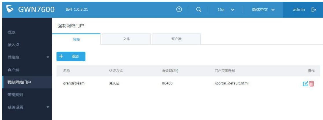
图表 13 captive policy 配置页面