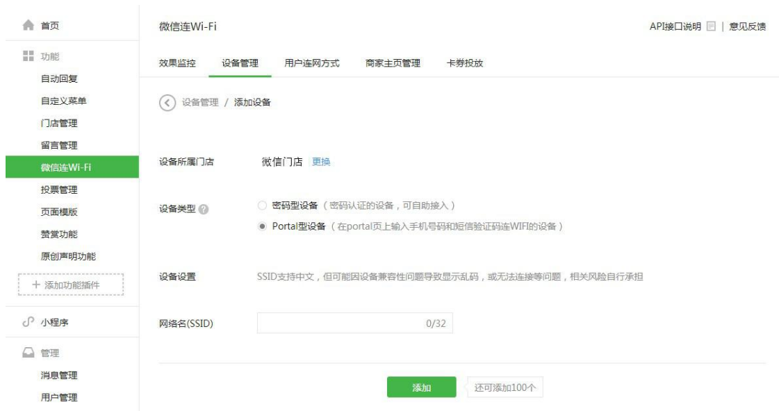
图表 10 微信设备添加界面

保存设置后将会出现微信商店信息，其中下图中的红框部分将会在 GWN 产品 portal 设置中用到。