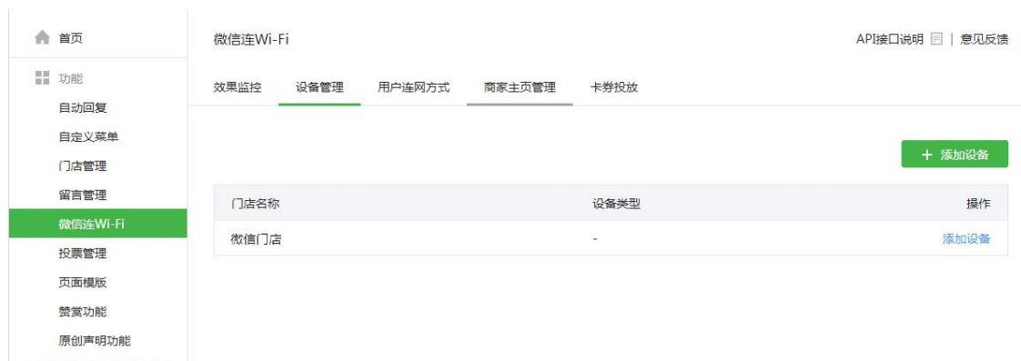
图表 9 微信设备管理页面

5 在微信连 Wi-Fi 的设置页面，点击“设备管理”进入设备管理的标签页，如下图所示：