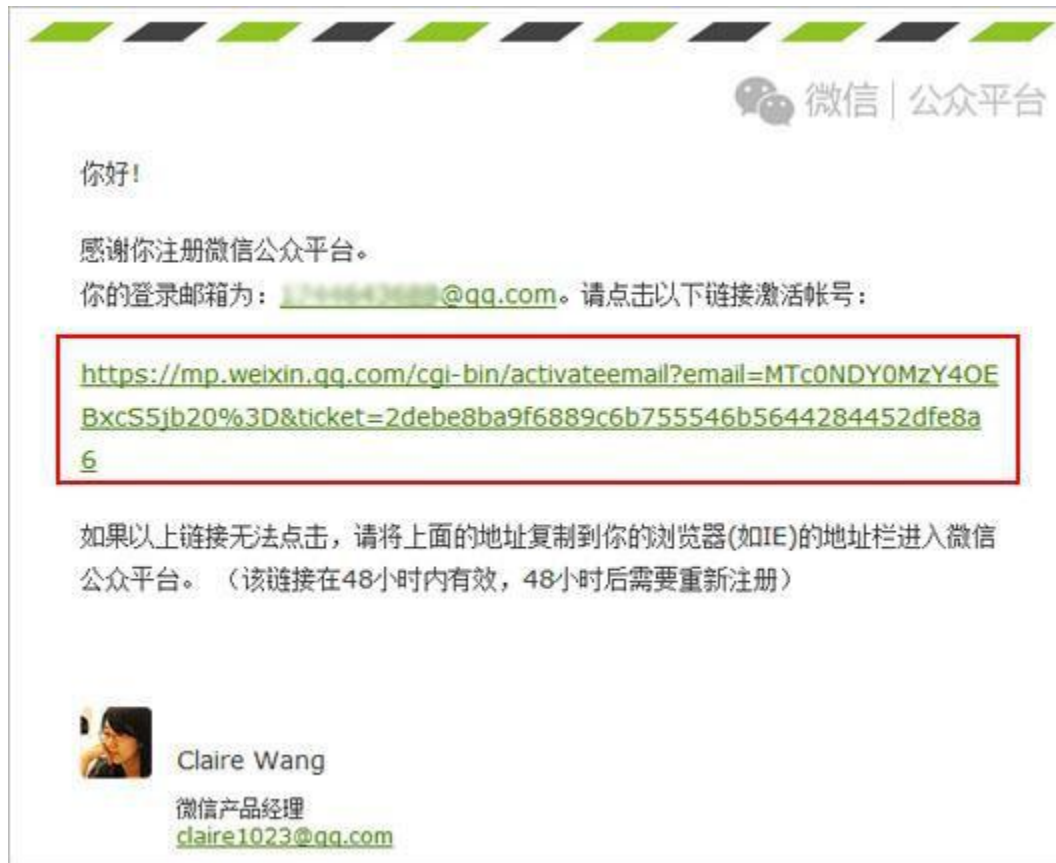
图表 4 账号激活邮件